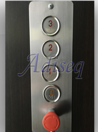
TIPO DE BOTONERAS