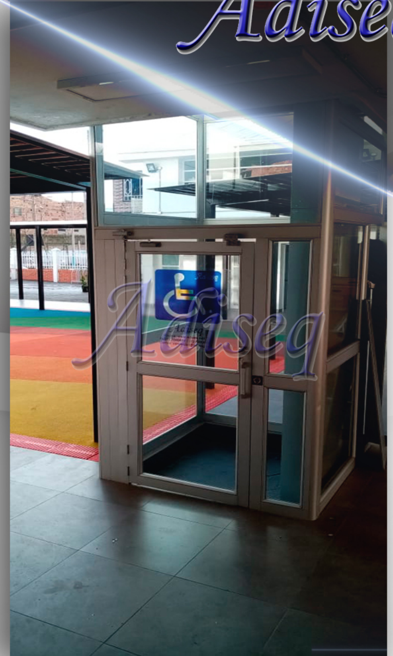
Elevador tipo panorámico