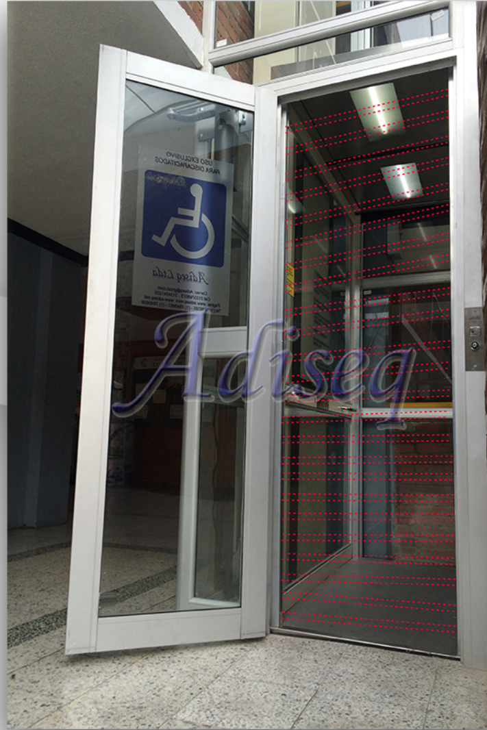
CORTINA LED INFRAROJA