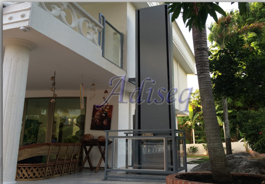
Elevador para discapacitados tipo torre